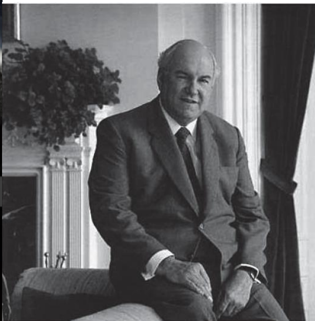
L'honorable Maurice Sauvé