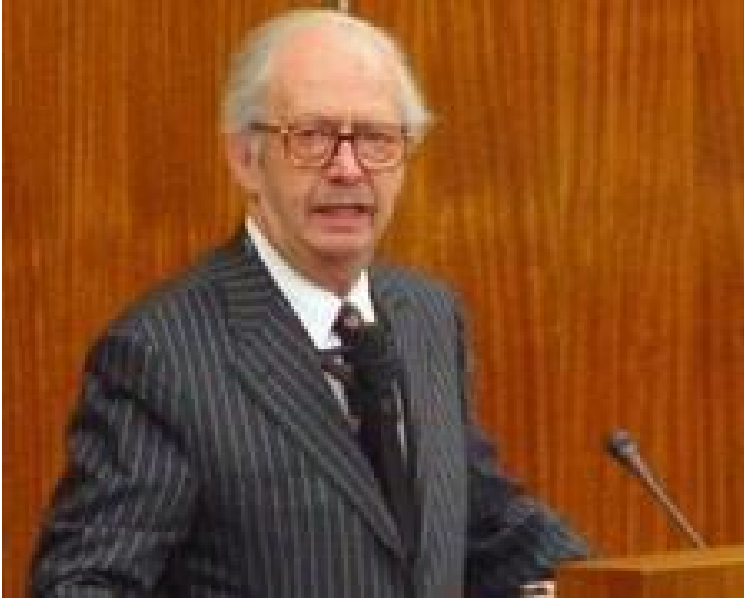
Le professeur Ralf Dahrendorf, intellectuel libéral

1958 - Copenhague, Résolutions sur le désengagement, le marché commun et la zone de libre-échange commerciale, le Moyen-Orient et l'Allemagne de l'Est