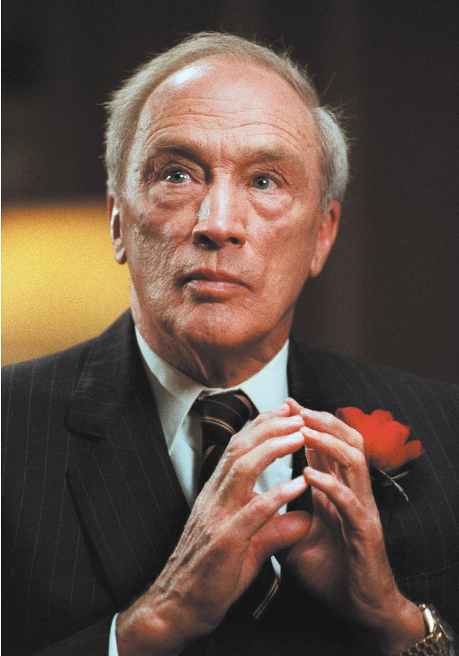
Le premier ministre Pierre Elliot Trudeau