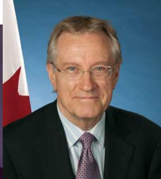
L'honorable Bill Graham, trésorier de l'IL L'honorable Art Eggleton, vice-président de l'IL

Le financement est un problème perpétuel et le Canada est mentionné comme l'un des pays où l'on a tenté de se sponsoriser à l'aide des particuliers et des entreprises. Les frais du PLC sont souvent impayés, un problème encore plus prononcé lorsque les règles de financement et de dépenses des partis politiques sont devenues strictes sous le premier ministre Chrétien, puis plus strictes sous le premier ministre Harper.